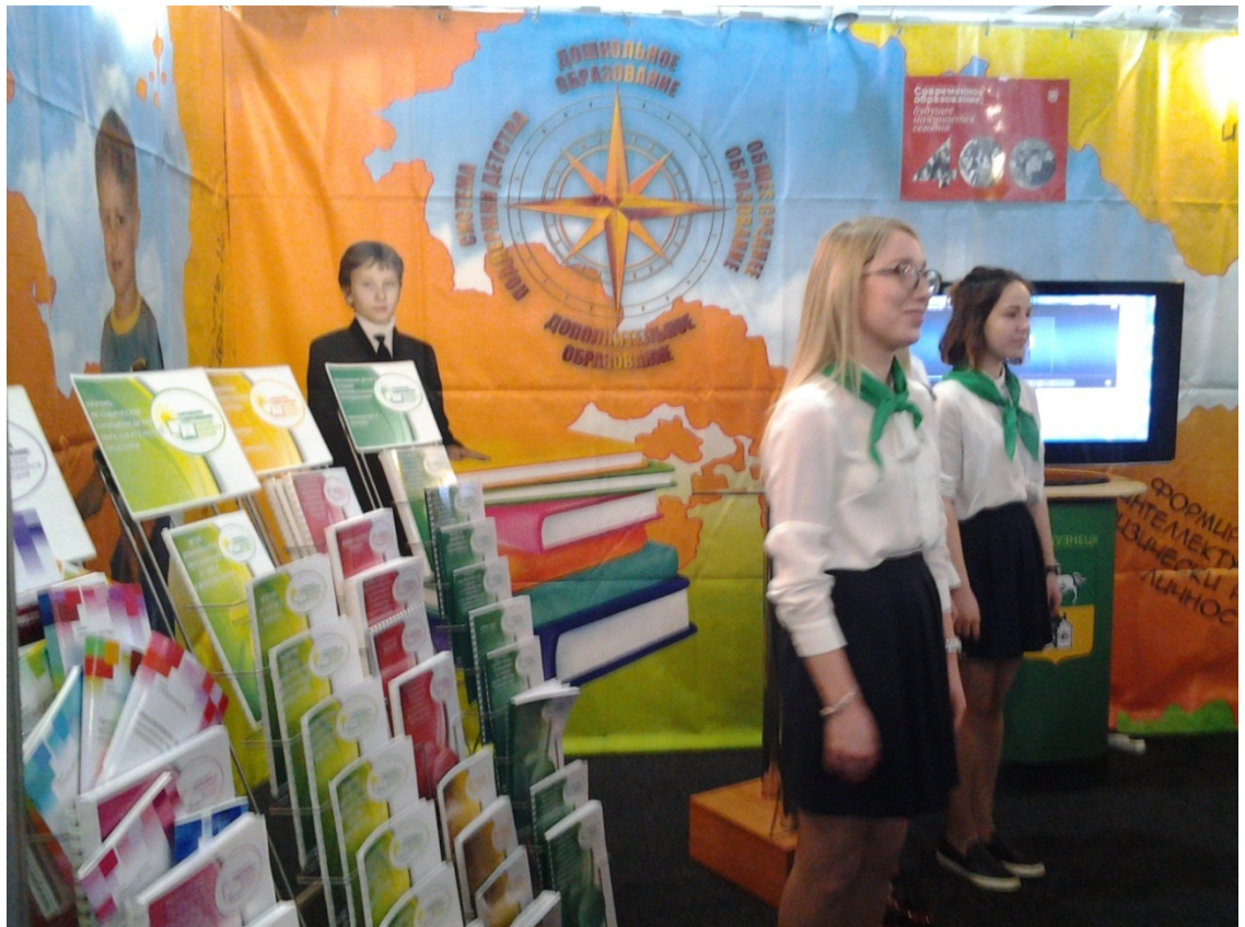
Материалы стенда КОУН и МАОУ ДПО ИПК содержат и материалы гимназии