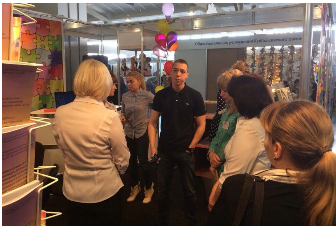
Знакомство с экспозицией Ярмарки