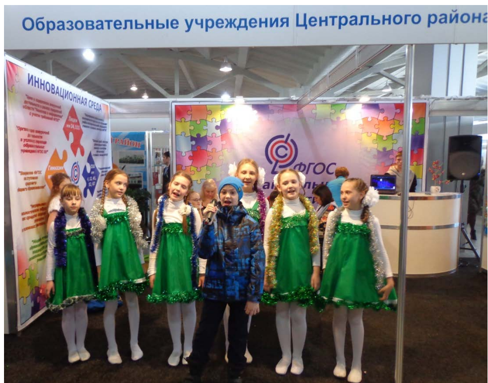
Презентация экологического проекта