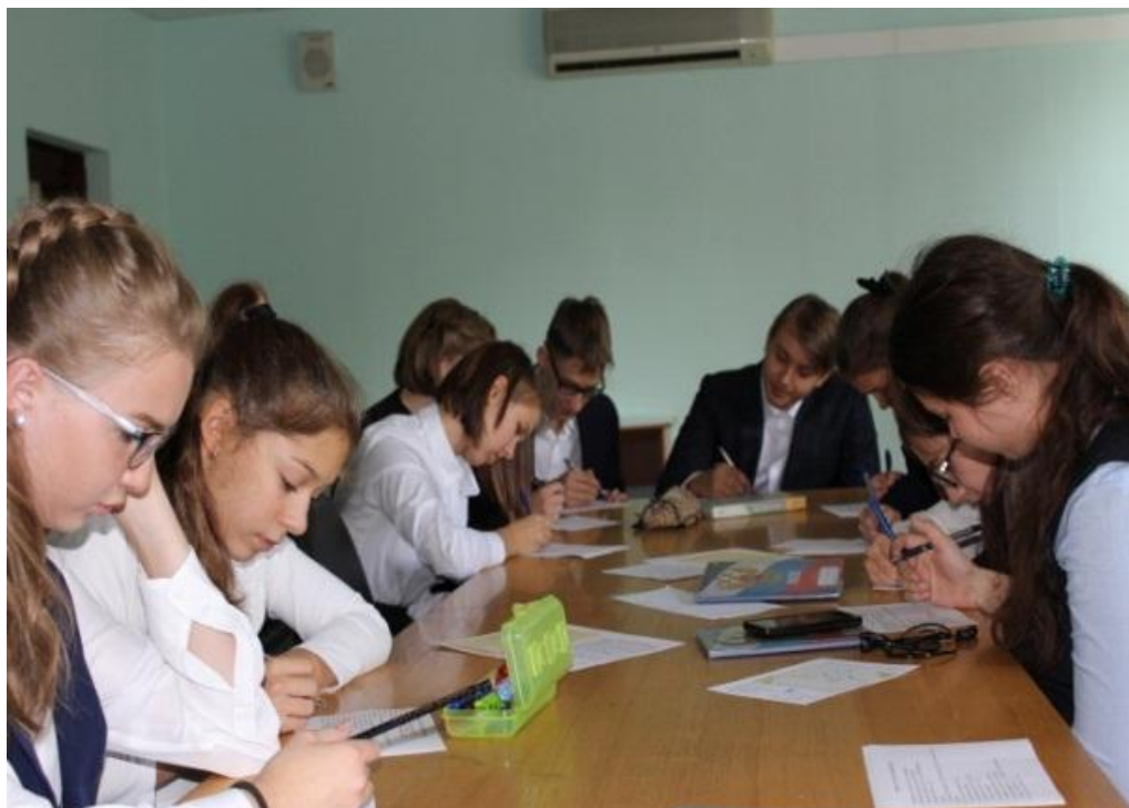
Учащиеся 9 «А» работают с опросником «Мой выбор»